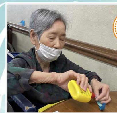
画用紙で 大輪の花火